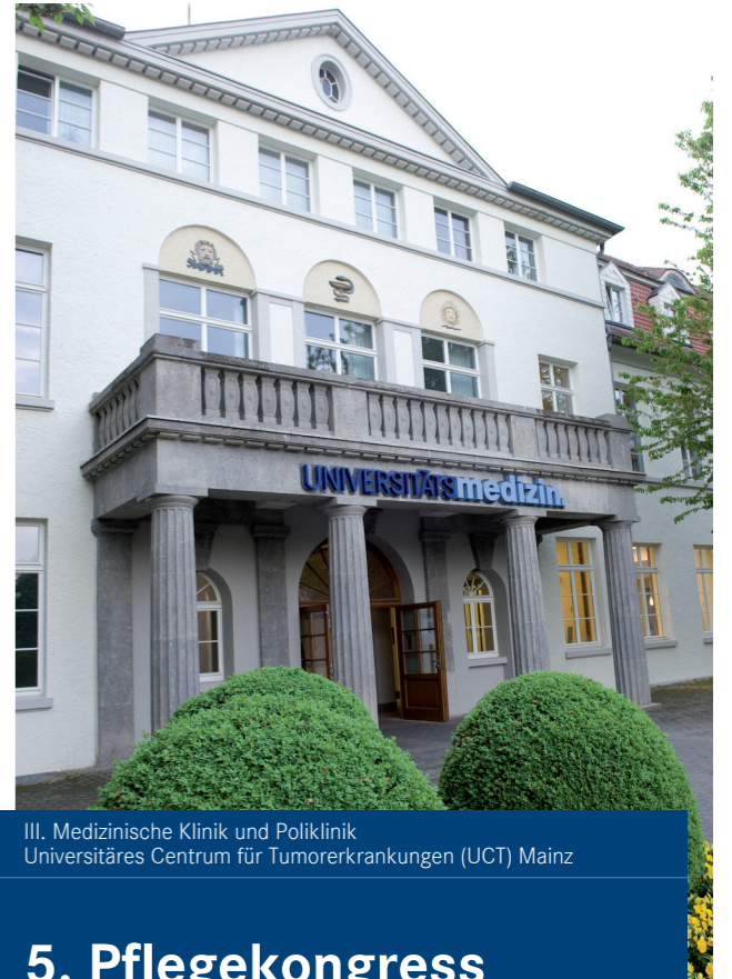
III. Medizinische Klinik und Poliklinik Universitäres Centrum für Tumorerkrankungen (UCT) Mainz